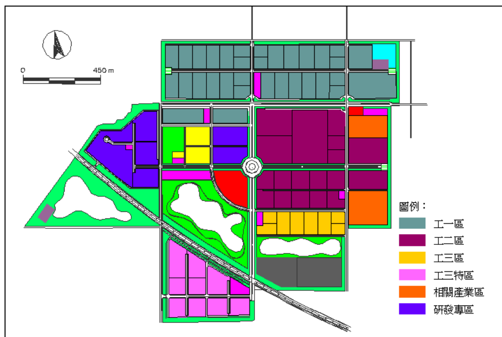
產業配置分區管制圖

由農業生物科技園區管理局直接興建模矩式標準廠房承租予中小規模廠商使用，廠房建築除為作業場所及一般公共設備使用外，得為辦公室、倉庫、生產實驗、訓練等使用，並得設置足夠之裝卸與員工、訪客停車場。